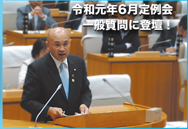
令和元年6月定例会 一般質問に登壇！